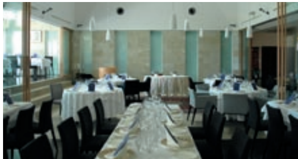
メインダイニング約30席の他、サロンスペースや個室もあり

営業 ■ランチ(金～日曜) 12:00～14:00 (LO) ディナー(火～土曜) 18:00～20:30 (LO)