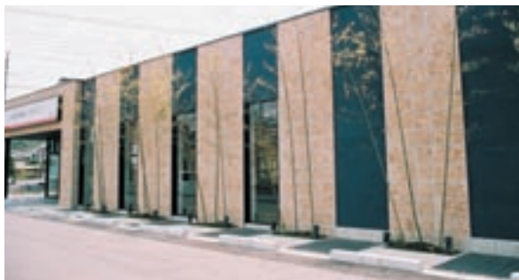
白沢街道沿いにある関東情報(株)が運営するドコモショップ宇都宮北店

営業 ■ 10:00~19:00 住所 ■ 宇都宮市岩曾町1321-2 電話 ■ TEL 028-683-0320