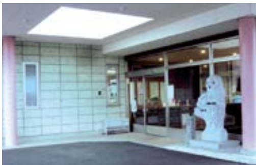
大谷石が張られた広々としたロビー