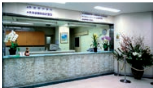
大谷石貼りのカウンター