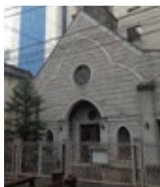
芦野石貼りのシロアムチャペル外部